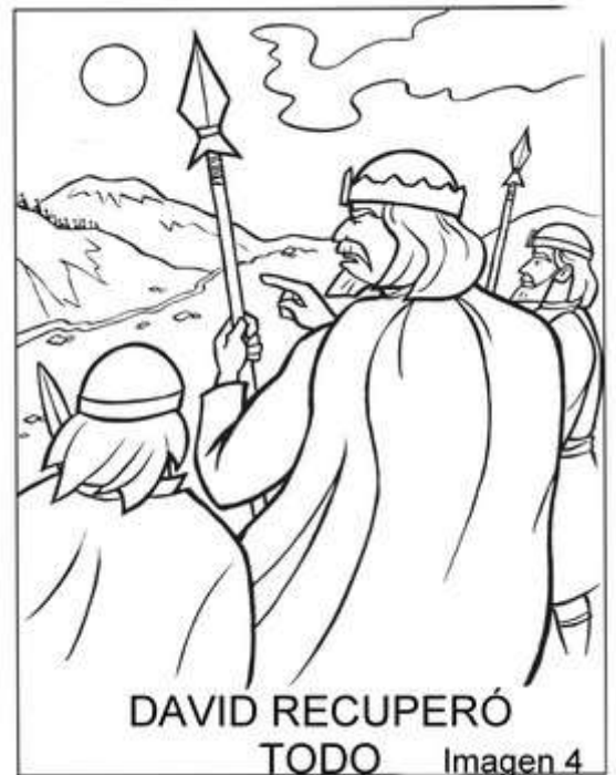
DAVID RECUPERÓ TODO Imagen 4